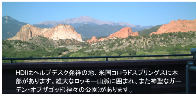
HDIはヘルプデスク発祥の地、米国コロラドスプリングスに本部があります。雄大なロッキー山脈に囲まれ、また神聖なガーデン・オブ・ザ・ゴッド(神々の公園)があります。