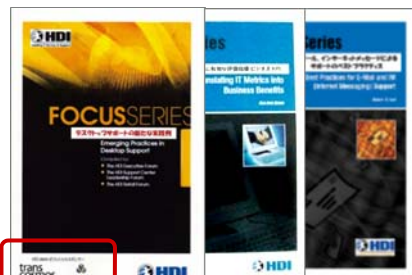
フォーカスシリーズ (特定のテーマに特化し専門家が 書き下ろしたもの)