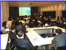
HDIアカデミー基調講演

HDIの各種イベントでは、サポートサービスに携わる各企業の責任者が数多く集結します。これらイベントでのHDIパートナー紹介、資料配布、製品デモの紹介や展示は、多くのビジネス機会が期待できます。