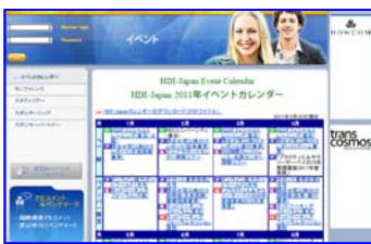
イベントカレンダー