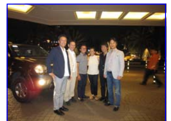
訪問先企業での具体的なディス カッションや、現地要人との会議

パートナー様と連携した国内マーケティング、視察先での訪問先やイベント参加アレンジ、現他企業との提携折衝支援などを行うことが可能です。主な視察先は、北米、東南アジア、オセアニアです。