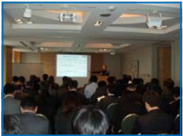
ネットワーキングフォーラム