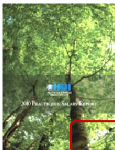
プラクティス&サラリーサーベイ (サポートセンター実態調査)

サポートサービスにかかわる出版物を数多く出しています。その多くはペーパーバック版とデジタル版とがあり、いつでもどこでも参照できます。HDIマーケティングパートナーはこれらの出版物で企業紹介が可能です。