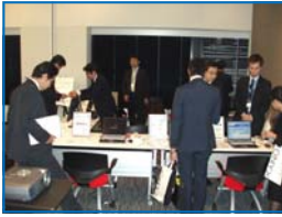
アカデミー展示テーブル