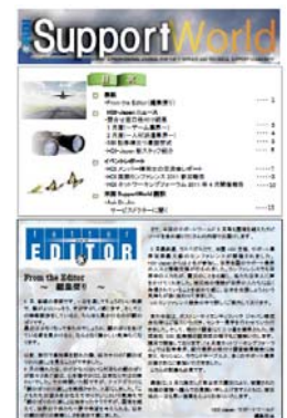
HDIメンバー誌 「サポートワールド」年6回発行