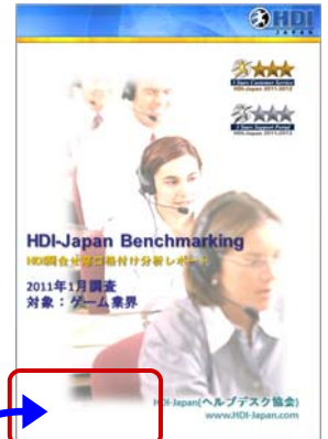
HDI格付けレポート表紙