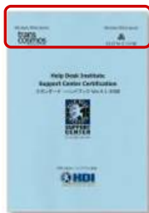
HDI国際スタンダード書および スタンダードハンドブック