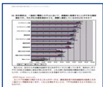
世界のサポートセンター 【実態調査結果報告】