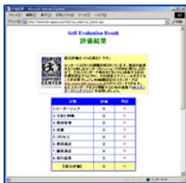
サポートセンター セルフアセスメント

メンバーシップサイトへのアクセス、メンバー登録は www.HDI-Japan.com こちらからどうぞ