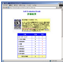
サポートセンター セルフアセスメント

メンバーシップサイトへのアクセス、メンバー登録は www.HDI-Japan.com こちらからどうぞ