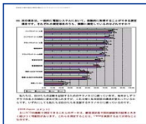
世界のサポートセンター 【実態調査結果報告】