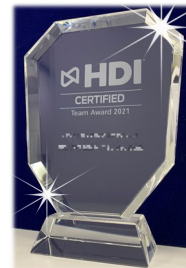
HDI Team Certified Award クリスタル盾